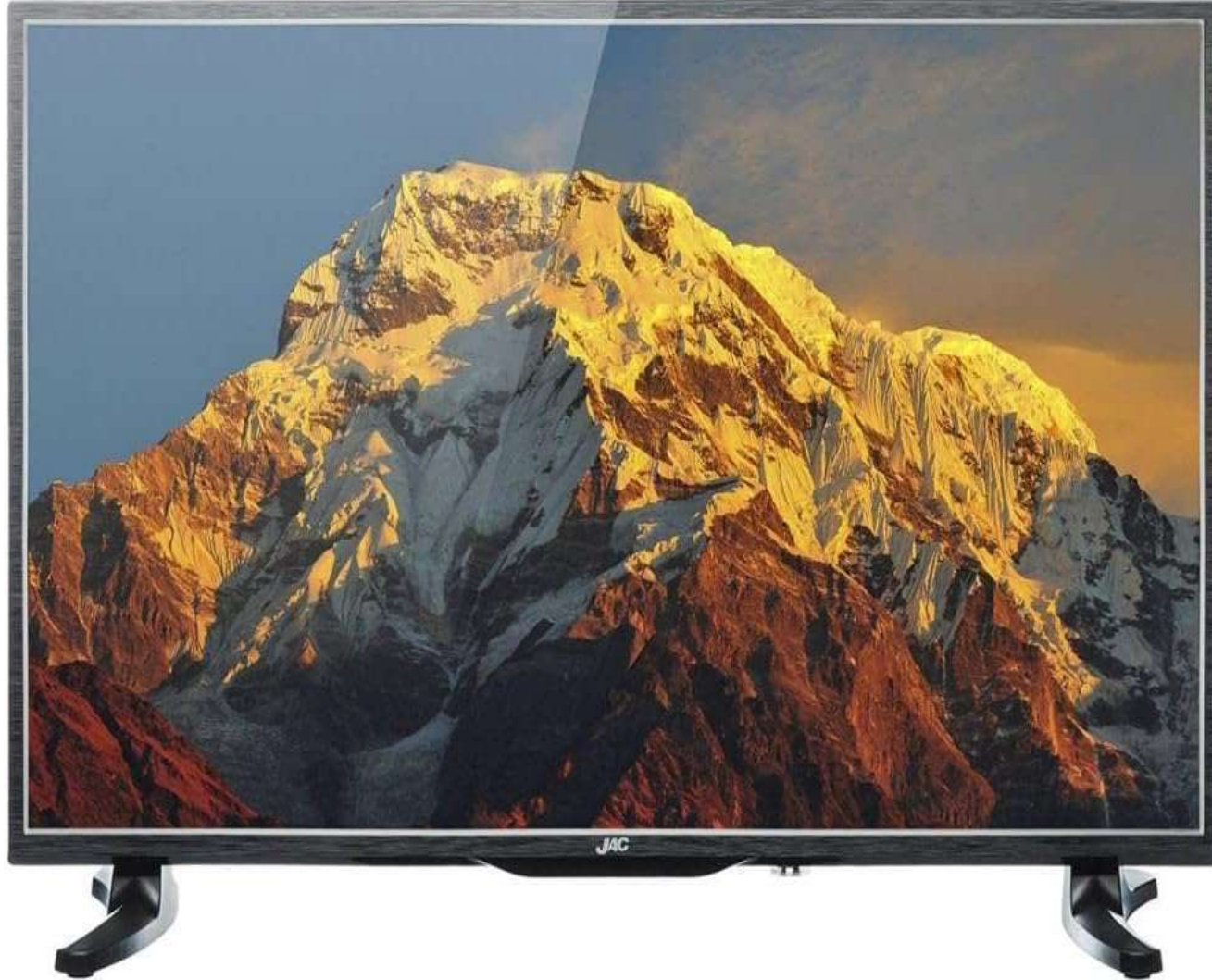
شاشة جاك 43 بوصة