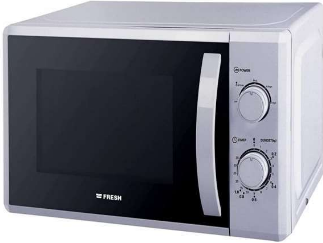
میکرویف فریش 20 لتر