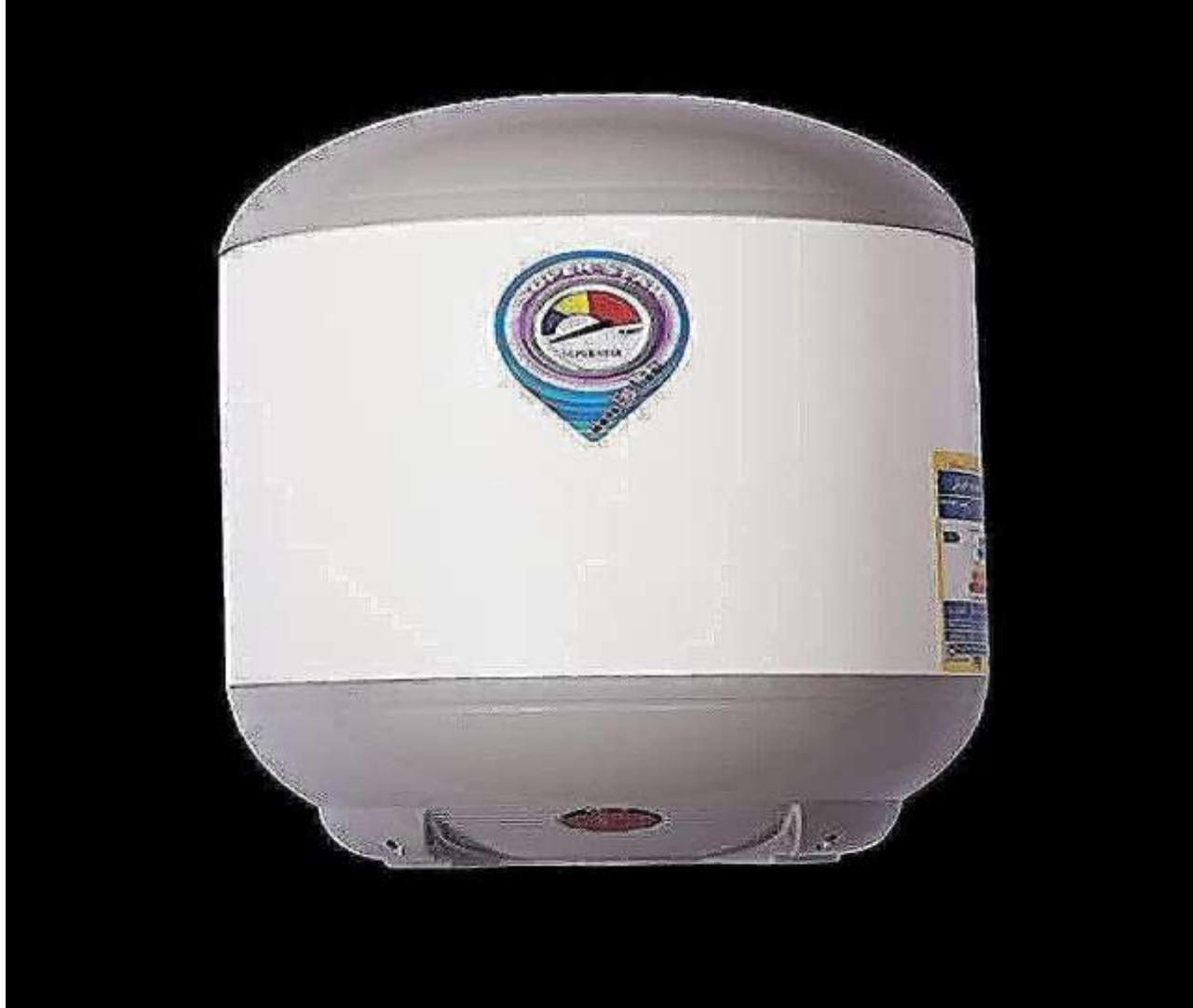
سخان 30 لتر نوفا