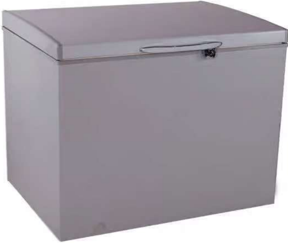
فريزر افقى يونيون اير